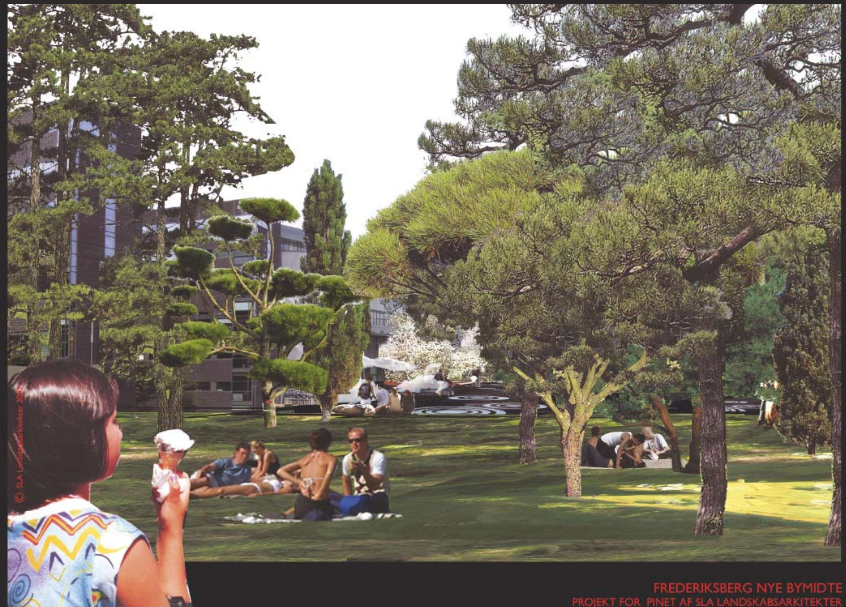
FREDERIKSBERG NYE BYMIDTE PROJEKT FOR PINET AF SLA LANDSKABSARKITEKTER